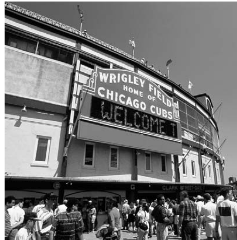
Le Wrigley Field où les Cubs de Chicago jouent leurs parties à domicile.

Les gens l'adorèrent et commencèrent à en acheter. Il est devenu tellement riche par la vente de sa gomme qu'il a été capable d'acheter l'équipe professionnelle de baseball les Cubs de Chicago. Il leur a aussi construit un stade, le Wrigley Field. Puis, il acheta une île au large de la côte du sud de la Californie, l'île Catalina, où il pouvait relaxer et avoir du bon temps.