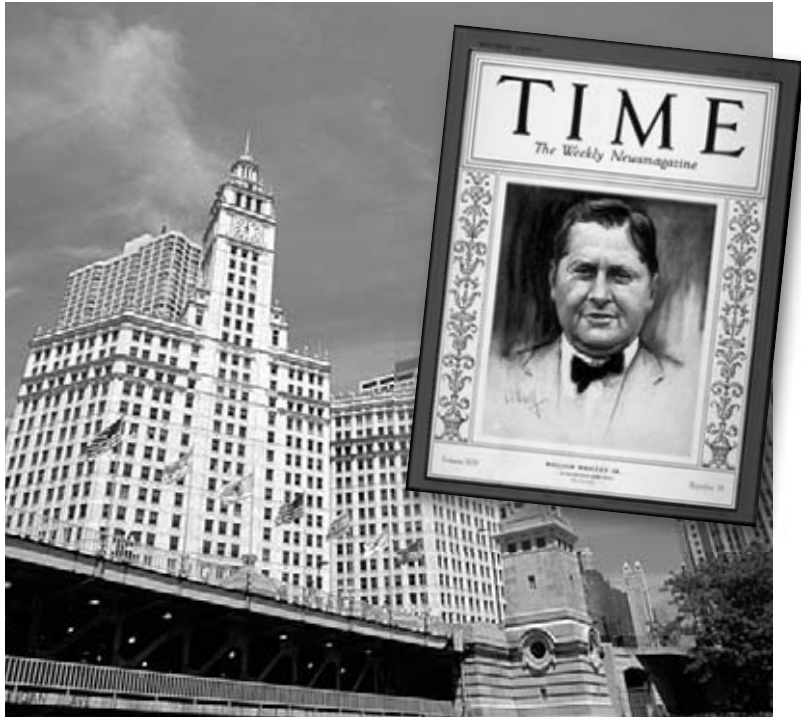
L'édifice Wrigley au centre ville de Chicago auquel on a donné le nom de la famille Wrigley.