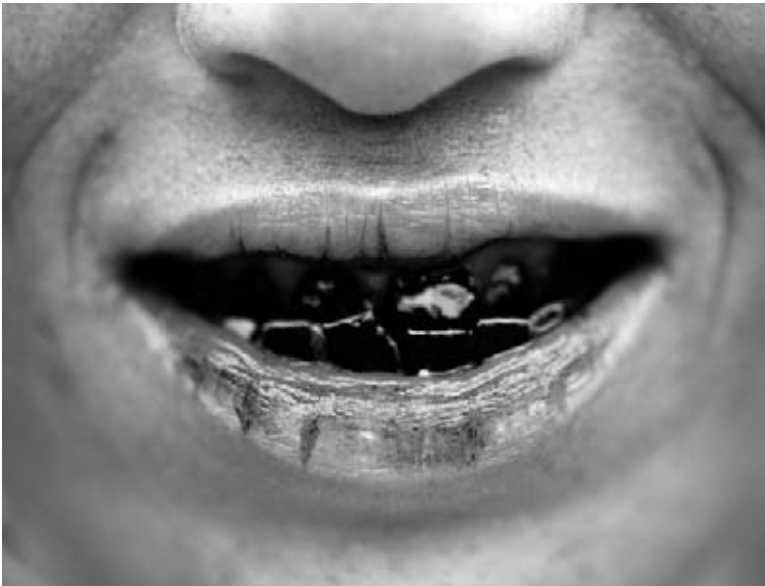
Mâcher des noix et des feuilles de bétel rend les dents rouges.

Les gens de la Grèce mâchaient du mastiche . Les indigènes de l'Amérique du Sud mâchaient du chiclé . Aux Indes, le bétel était populaire.